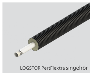
LOGSTOR PertFlextra singelrör

Mediarördimension 25–63 mm och mantelrördimension 90–180 mm.