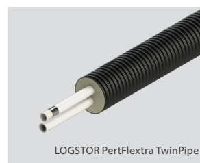
LOGSTOR PertFlextra TwinPipe